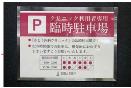
壁面にこの表示板があります。